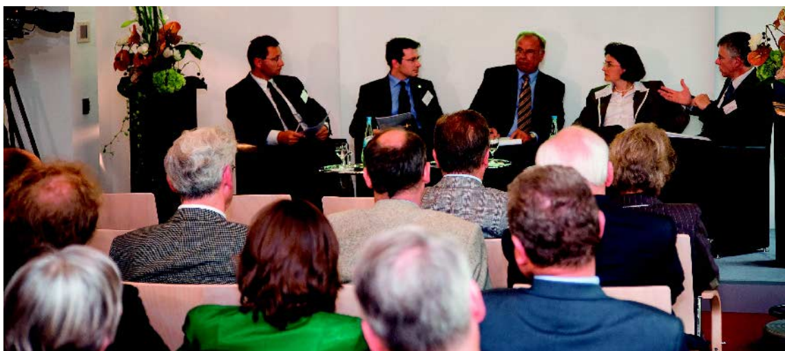
Podiumsteilnehmer und aufmerksame Zuhörer während der RHI-Veranstaltung zum „bedingungslosen Grundeinkommen“

Die komplette Verwerfung des Subsidiaritätsprinzips als Gestaltungs- und Organisationsprinzip der Sozialstaatlichkeit ist tatsächlich ein typisches Kennzeichen der Vorschläge eines Grundeinkommens aller Couleur. Die angeblich aus Gründen der Fairness angezeigte Verschonung von Familienangehörigen wirkt jedoch allenfalls auf den ersten Blick nachvollziehbar. Dass jemand, der Lebenspartner oder Familienangehörige hat, die ihn im Notfall unterstützen können, benachteiligt sei, ist eine absurde Feststellung. Ein solcher Nachteilsbegriff ließe sich auf alle Systeme anwenden, die unglücklichen Bürgern bei der Bewältigung von Notlagen und Krisensituationen helfen: Die glücklichen Bürger erhalten jeweils weniger Hilfe, so ziehen beispielsweise gesunde Menschen weniger Profit aus einer Krankenversicherung als Kranke. Menschen mit Partnern, Familie und Freunden brauchen ähnlich wie Gesunde weniger Hilfe durch anonyme Dritte, bedauerndwert sind sie deshalb nicht. Im Gegenteil: Die durch Familienverbände und Lebenspartner erfahrbare Unterstützung in Notlagen ist sicherlich einer der wichtigsten Vorteile des partnerschaftlichen Zusammenlebens.